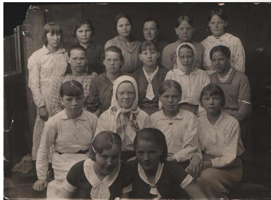
Ученицы 9-ого класса Карпогорской школы. 1940 год

29 выпускников 15 - стали солдатами 10 – погибли в годы Великой Отечественной войны 14 - работали в тылу 19 - после войны достойно трудились в народном хозяйстве и сфере образования